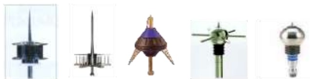
Pararrayos Franklin con dispositivo de cebado (PFDC)