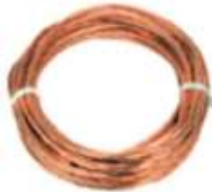
Cable de cobre