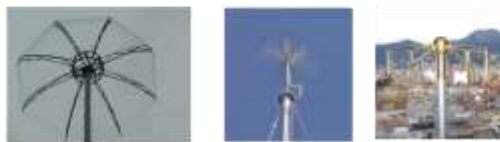
Pararrayos Franklin multipuntas, tipo erizo y tipo puntas invertidas (PFM)